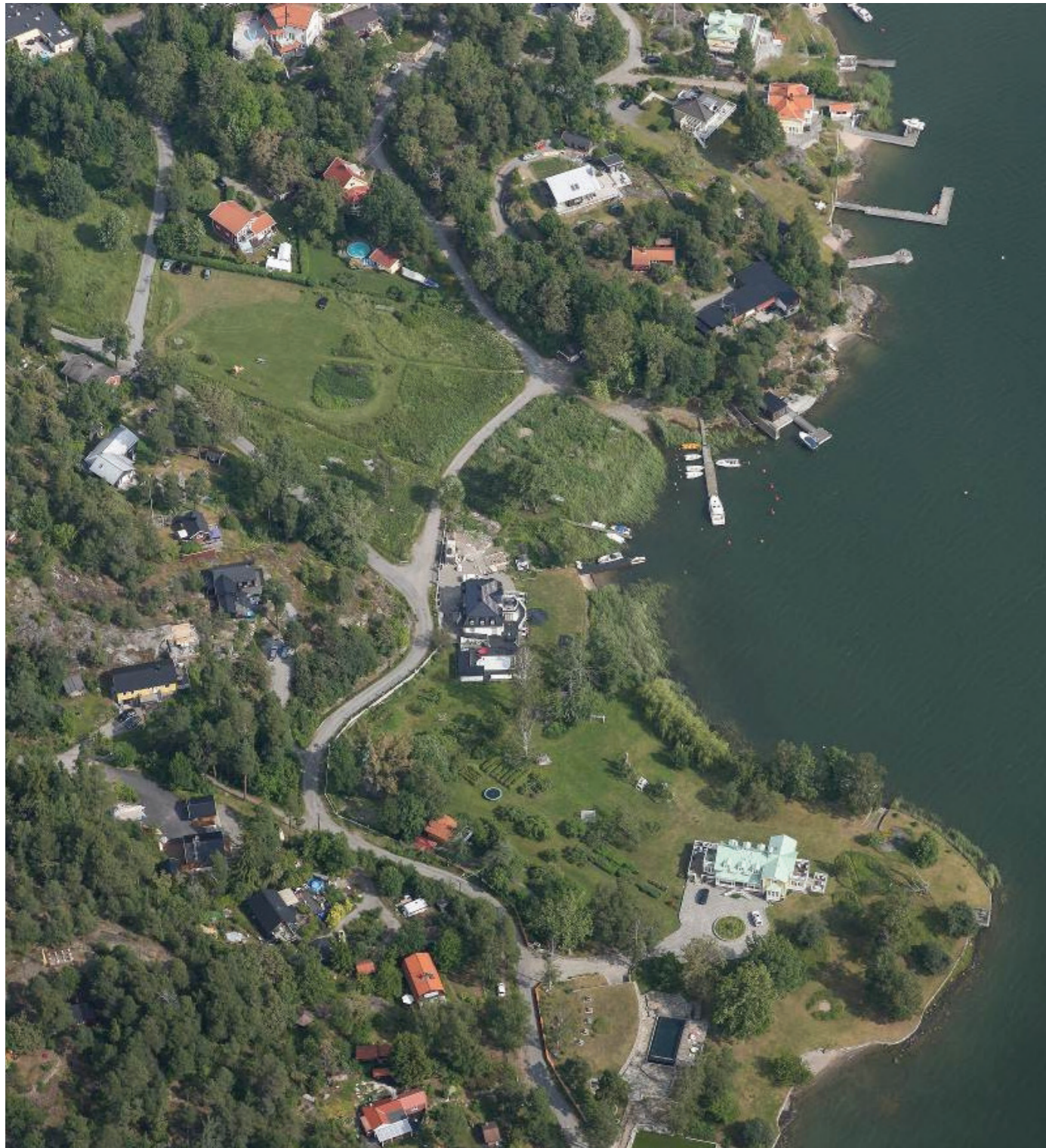
Flygfoto planområdet. Kommunen föreslås ta över parken vid Fiskebovägen.