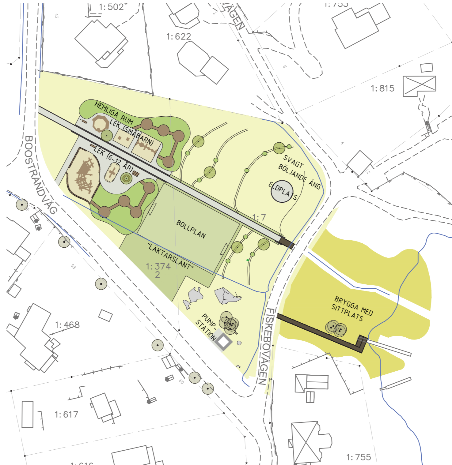
Förslag till ny utformning av parken vid Fiskebovägen (Sigma, 2018).